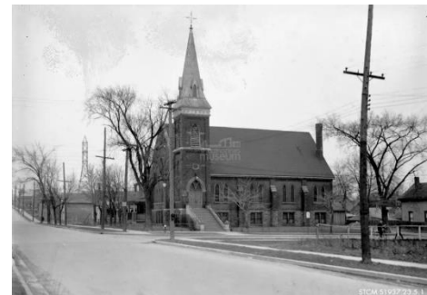
St. James Anglican Church, 1937. STCM S1957.25.5.1