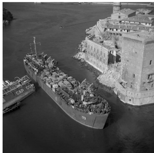
Geallieerd schip geladen met voertuigen en voorraden vaart Marseille binnen, Frankrijk Haven 1945 tijdens "Operatie Goldflake"