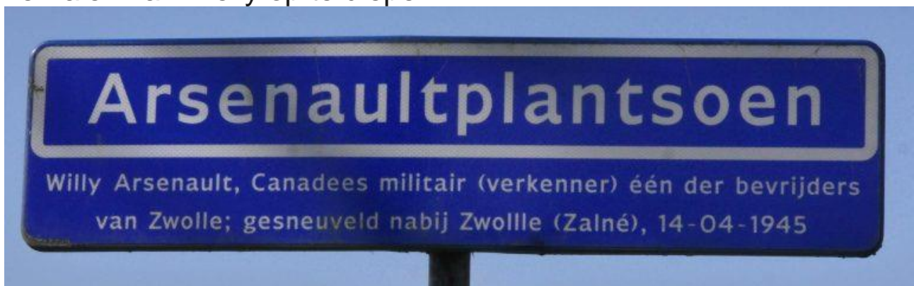
Straatnaambord in Zwolle.