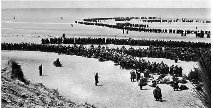
Wachten op evacuatie.

Dat dat geen succes werd moge bekend zijn.