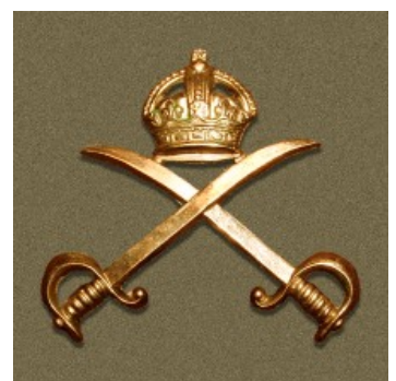
Badge Royal Physical Trainings Corps

Voor de dames had hij speciale fitness lessen ontwikkeld.