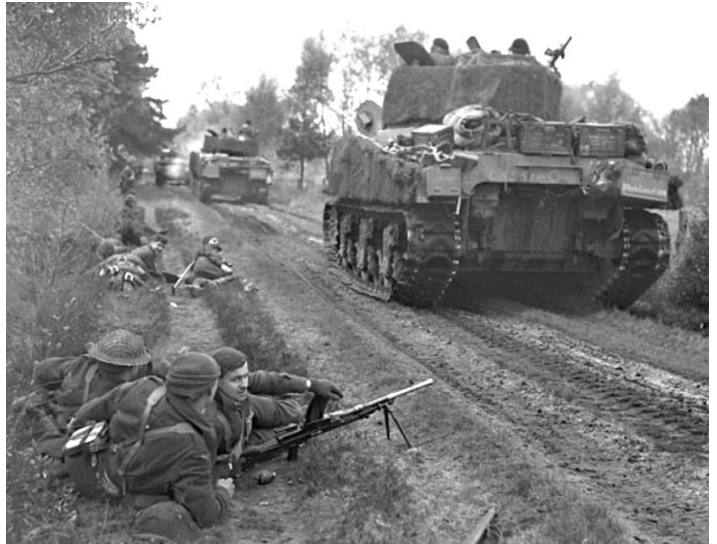
Sherman tanks en FMR onderweg naar Munderloh