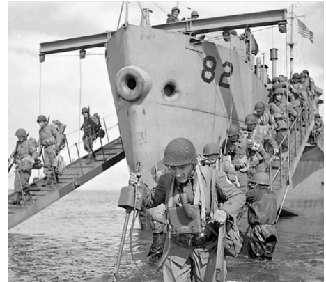
Landing 13e Inf. Brigade in Kiska