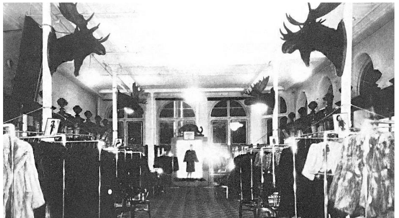
Eén van de etages van Laliberté in 1941