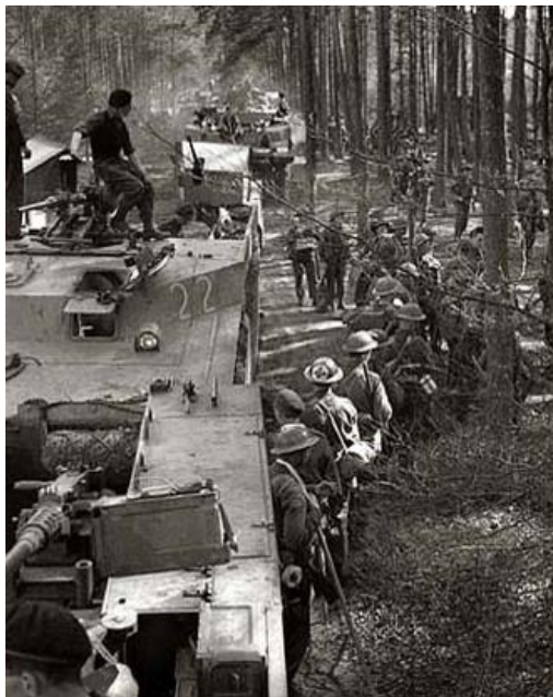
PPCLI maakt zich klaar om de IJssel over te steken 11 april 1945

Massale geheime troepenverplaatsing van Canadese troepen in Europa. De inscheping begon op 22 februari en de meeste reizen naar Marseille duurden twee dagen. Het was toen vijf dagen rijden naar de Belgische grens, een afstand van 1085 km. Eind april waren meer dan 60.000 troepen en ondersteunend personeel van Italië naar Noordwest-Europa overgebracht.