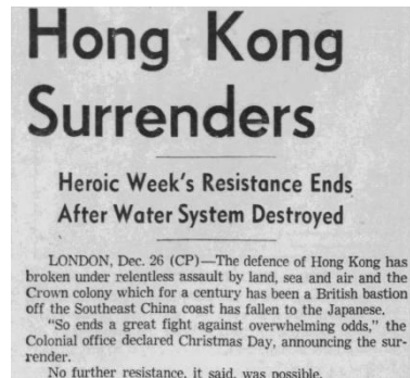
Calgary Herald 26 December 1941

Soldaat David Girard werd op 21 december 1941 als vermist in actie opgegeven tijdens de Slag om Hong Kong, die al snel in Japanse handen viel en waarbij veel krijgsgevangenen werden gemaakt. De familie Girard kreeg pas na het einde van de Tweede Wereldoorlog bericht over zijn lot.