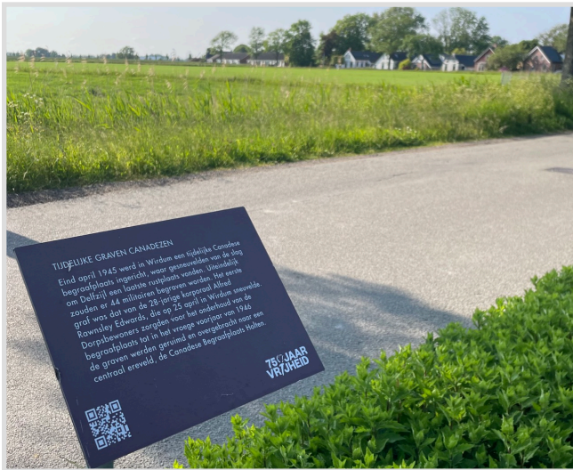
Wirdum, tijdelijke begraafplaats