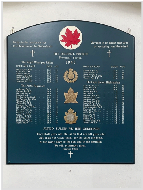
Plaquette in de kerk van Holwierde