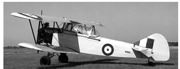
Fleet Finch 16B

In de jaren veertig was Fleet Aircraft in Fort Erie, Ontario, een belangrijke Canadese fabrikant. Ze produceerden de Fleet Finch (Model 16B) als primair lesvliegtuig, waarvan er in 1941 meer dan 400 werden geleverd, en ontwikkelden de Fleet 60K Fort (die in 1940 voor het eerst vloog) als intermediair lesvliegtuig.