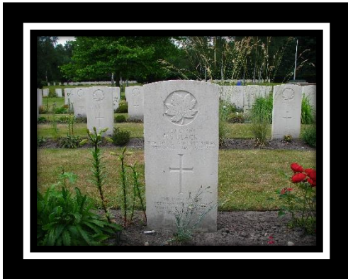
Begraafplaats te Holten

Op 7 april 1945 sneuvelde Black bij Oxe, tijdens de slag om Deventer. Nu ligt hij begraven op de Canadese begraafplaats te Holten, in plot 2, rij B, graf 5. Op zijn grafsteen staat de tekst: 'The Lord watch between me and thee when we are absent one from another.'