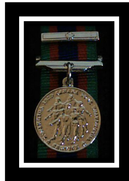
C.V.S.M. & Clasp