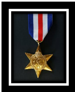
France & Germany Star