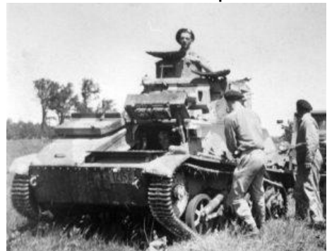
Camp Borden, ON WW2

Teds broer, luitenant Jack Wallace, diende bij zijn Three Rivers tankregiment (12CAR) in Termoli, Italië, ter ondersteuning van de Britse infanterie tijdens een aanval op 6 oktober 1943. Hij voerde het bevel over hun "C" Squadron nummer 5 Troop en bevond zich in de voorste tank toen deze door verschillende vijandelijke granaten werd geraakt. Zijn chauffeur en schutter kwamen om het leven en een van Jacks benen werd verpletterd. Later verloor hij zijn been en ontving hij een Militaire Kruis voor zijn daden die dag.