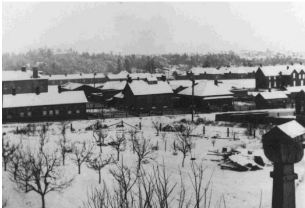
Work Point Barracks, Esquimalt, BC