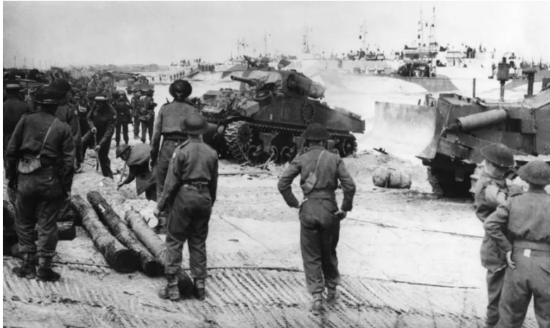
Troops from the Royal Winnipeg Rifles and Regina Rifles watch as tanks of the 1st Hussars land near Courseulles-sur-Mer, France, on D-Day in

De 1st Hussars maakten deel uit van de 2nd Canadian Armoured Brigade, samen met het Fort Garry Horse (10th Armoured Regiment) en de Sherbrooke Fusiliers (27th Armoured Regiment). Het 6CAR ondersteunde de 7e Canadese Infanteriebrigade op D-Day bij het vestigen van een bruggenhoofd in Courseulles-sur-Mer, Frankrijk.