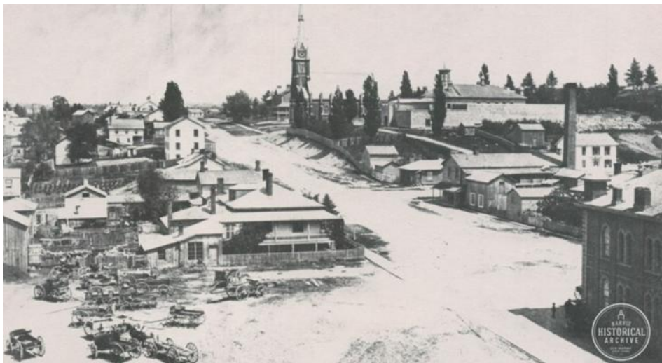
St. Mary's Catholic Church, Barrie, ON