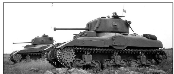
Training in Camp Borden

Dan volgt opnieuw een verplaatsing. Eind februari 1944 wordt Walter geplaatst in Camp Borden, Ontario. Hij is dan ingedeeld bij het CAC, het Canadian Armoured Corps, dat hier een opleidingscentrum heeft.